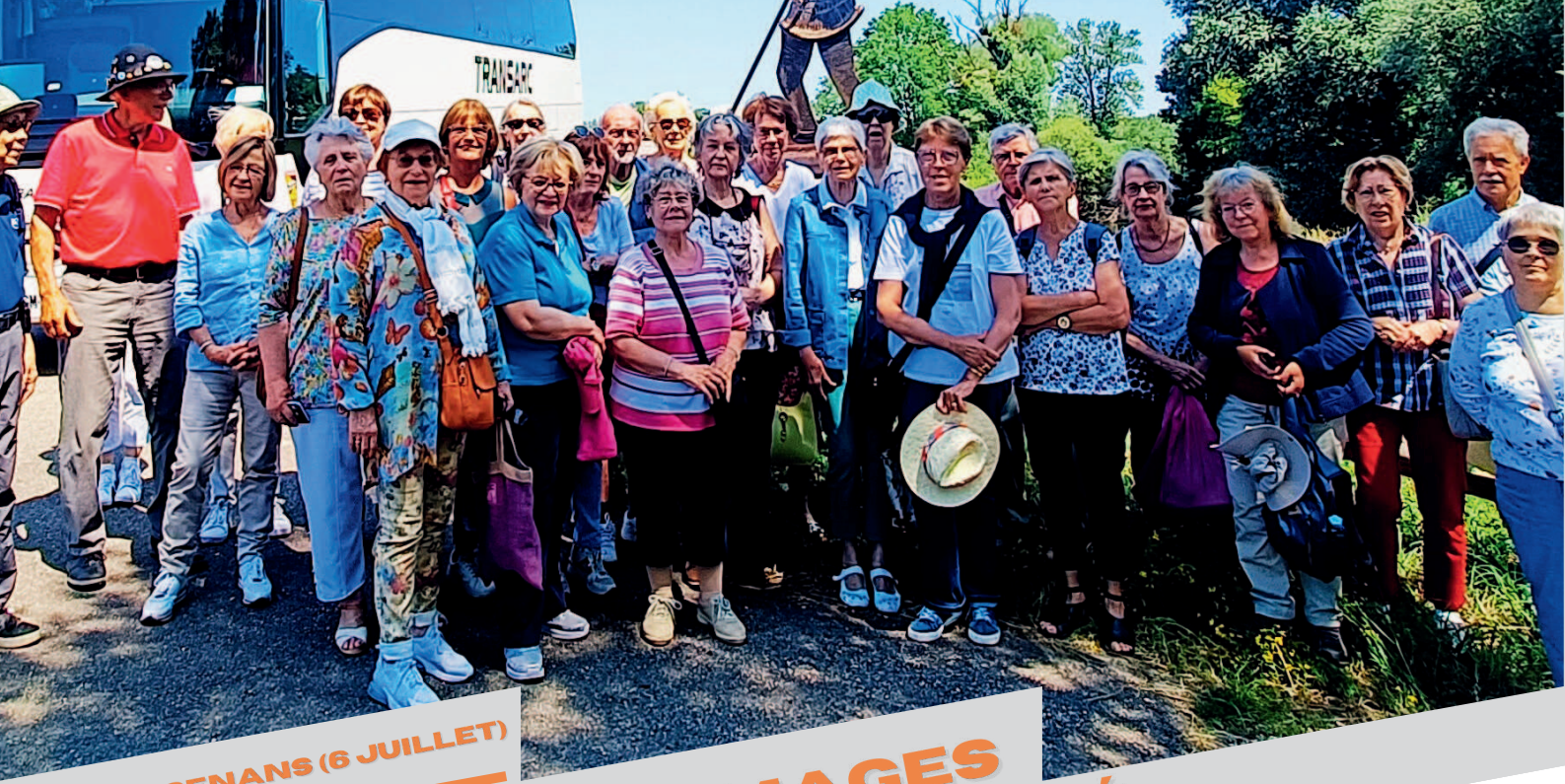
ARC-ET-SENANS (6 JUILLET)