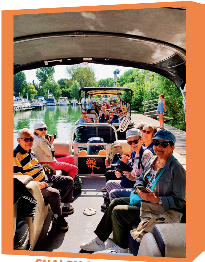
CHALON-SUR-SAÔNE (18 JUILLET)